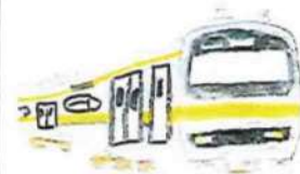
E231系 総武線からやってきた。 現在も走っている。