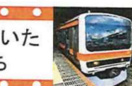
201系 武蔵野線で走っていた期間は短かった。 1996年引退