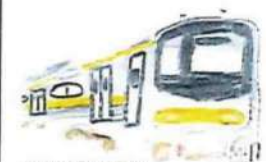
205系0番台 通称メルヘン顔。 2019年引退