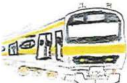
209系500番台 総武線・京葉線からやってきた。 現在も走っている。