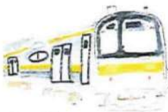
205系5000番台 2020年引退 引退後、インドネシアに輸出された。