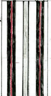
タイヤで走る軌路