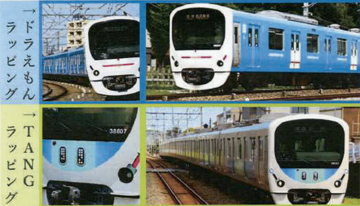
→ドラえもんラッピング