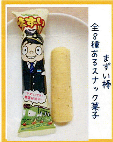
全8種あるスナック菓子 まずい棒