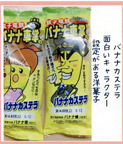
バナナカステラ 面白いキャラクター 設定がある洋菓子