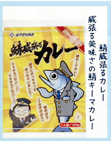
鯖威張るカレー 威張る美味さの鯖キーマカレー