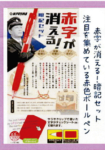
赤字が消える! 暗記セット 注目を集めている赤色ボールペン