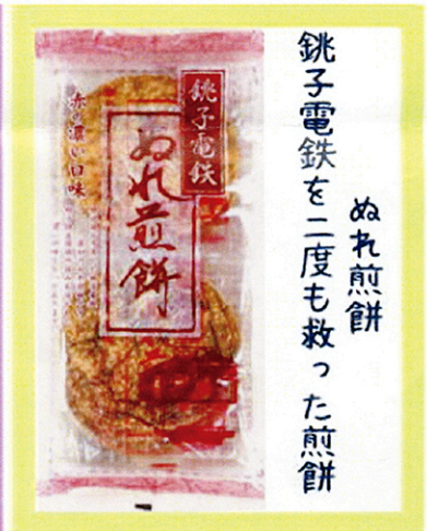
ぬれ煎餅 銚子電鉄を二度も救った煎餅