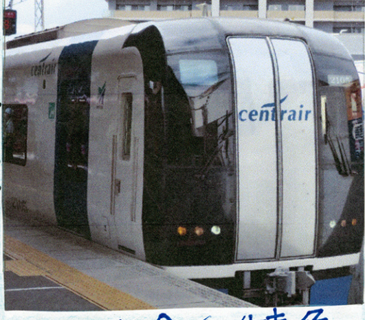
2000系特急 全車特別車

中部国際空港(セントレア)と名古屋古屋、新岐阜などの各都市を結ぶ空、ミュースカイの特急で「ミュースカイ」のまじようがある。四両編成の全車特別車がある。特別車で、いよいよ車にはミュースカイがひつよう。赤単体が特徴。この名鉄でゆいりつ青いカラーの電車。中にはたまにはもつがおける。ミュースカイは二階車内アナウンスでは、日本語だけでなく、英語、中国語、かん国語が流れる。世界中の人がミュースカイののることを考えている。なのと思っ。た。