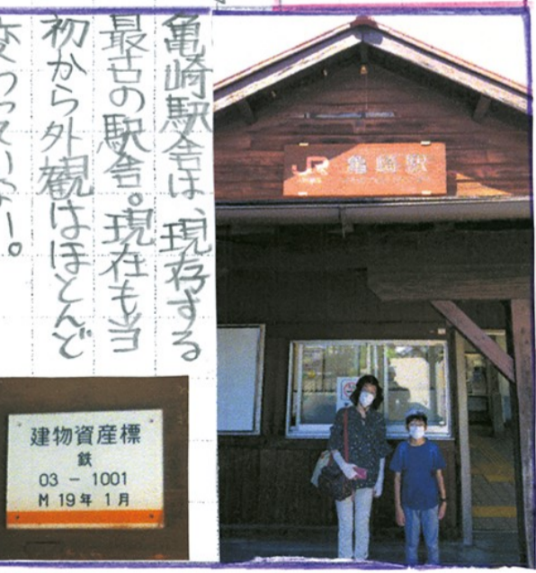
建物資産標 鉄 03-1001 M 19年 1月

豆知識 東京駅と同じ、武豊駅に向かう列車は全て上り列車! 編集後記 これまで武豊線以外の鉄道のことは知りませんでしたが、今回調べてみると、名鉄や衣浦臨海鉄道がこの地域の発展に貢献してきたことがわかりました。武豊線にもあつちの歴史を話や文化財なども多くの人に知ってもらい、未来に引きついでいきたいと思いました。 参考文献 。衣浦臨海鉄道資料集 。広報たけとよ。五〇二 。武豊線物語 河合由平 (文通新聞社) 。武豊駅展示パネル 。亀崎駅展示パネル http://gethain.jp/vehicles/41336/ 。注目の臨海鉄道③