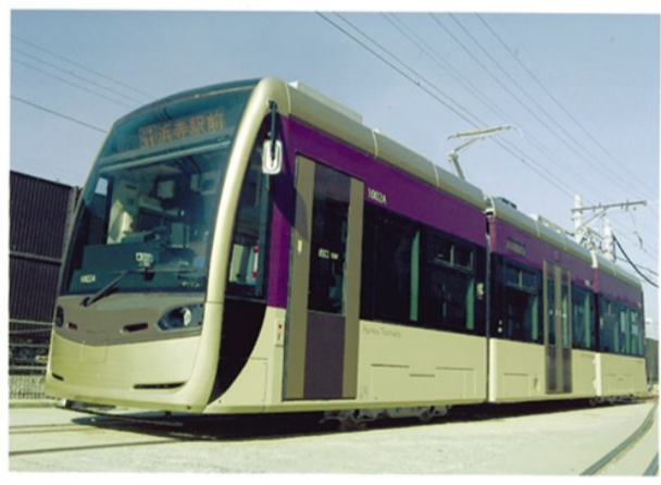
堺トラム 超低床式電車 3車体2台車 定員76人 (座席数27)

阪堺電気軌道株式会社と堺市との間で阪堺線の存続を図るために様々な支援を受けました。その支援策の一環として導入されました。 超低床路面電車 (2001形堺トラム) 堺トラムは誰でも乗り降りしやすいバリアフリー対応の車両