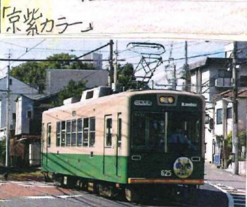
モボ611形、モボ621形、モボ631形は 合計14両が在籍、京福での最大勢力。