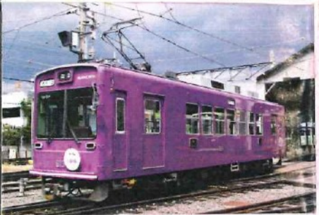
嵐電100周年を記念して標集色に決まった 「京紫カラー」