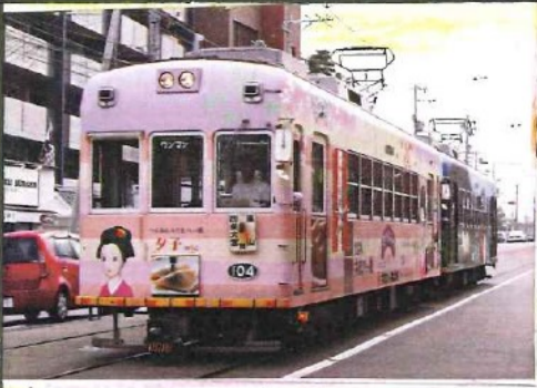
京福電気鉄道最古形形式