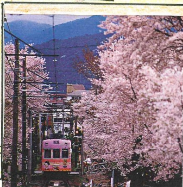
宇多野〜鳴滝間「桜のトンネル」

「嵐電」の名で親しまれる嵐山本線・北野線 を運営する、京福電車は、1910(明治43)年に 開業しました。京福は併用軌道区間があり、開業時 から路面電車タイプの電車が、使われています。床は 高床式で乗降扉のステップはありません。それほどの 高性能を必要としない路線のため、ポールによる 集電装置が1977(昭和52)年まで行われていました。