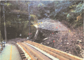
被災直後と復旧後の 大沢橋梁の様子