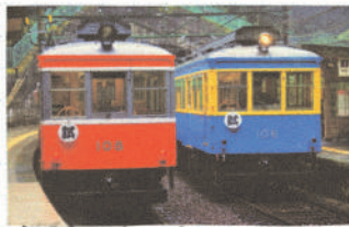
再開に向けた 試運転の様子