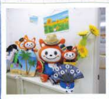
(季節に合わせた飾り)つけをしているいずみ野駅