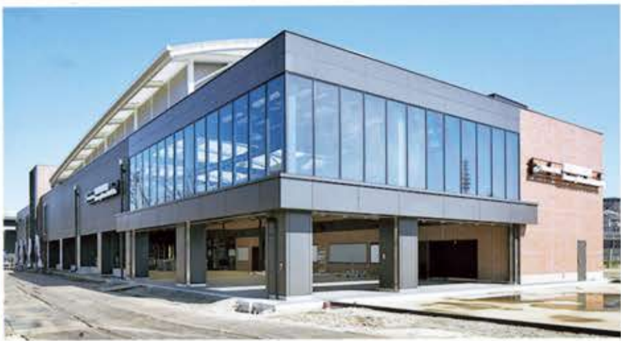
(新しくできる新駅・羽沢横浜国大)

めは○ 駅と横親入部 り新○ 相を、浜し達を相 (相相れし周年鉄走途駅まから模 定二鉄鉄てい年線る中かかれら ○・東JRますのえ○み侯考相 二急直直。路ま一野川名す。鉄 二年度直通線し七線駅を相と 下期開業のた。年かから走呼 進でーす。台線はれ住 進でーす。台線はれ住