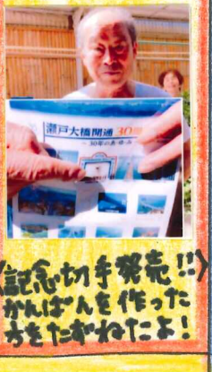
記念冊発売!! かんぱんを作った ちんがわにまよ!

ぼくたちは、夏休みに、岡山香川休日おでかけバスで快速列車マリンライナーに乗って岡山に遊びに行こう。7月の西日本ブライダルで心配だった倉敷にも山陽本線で行ってきだよ。