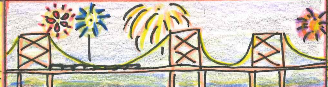
瀬戸大橋記念公園

と中下車した坂で、瀬戸大橋開通30周年記念花火大会があったよ。マリンライナーでいるんな所に行けたよ。