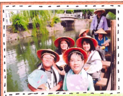
倉敷美観地区で川舟

ぼくたちは、夏休みに、岡山香川休日おでかけバスで快速列車マリンライナーに乗って岡山に遊びに行こう。7月の西日本ブライダルで心配だった倉敷にも山陽本線で行ってきだよ。