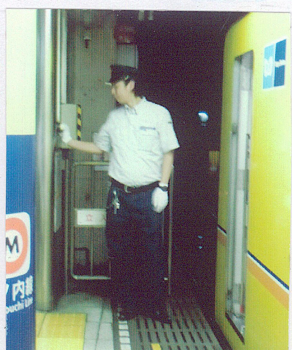
(△東京メトロの車掌さん)

駅員さんに聞いたり、ホームで見学したところ、鉄道会社によって方法はいろいろありますが、車掌さんかスイッチを押して鳴らす方法をとる会社が多いようです。車掌さんには、乗客の乗りおろしの様子や、時間とおりに運行されているかなど、いろいろな点に気を配りながら、発車メロディを鳴らしているのです。すごいと思います。