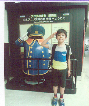
(△駅にある銀河鉄道の車掌さん)

2009年から使用。駅がある練馬区は、日本の発祥地「アノアノ」をモチーフにして、アノアノの曲が使用されている。この曲は、アノアノの曲が使用されている。これがPRで、アノアノの曲が使用されている。