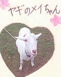
ヤギのメイちゃん