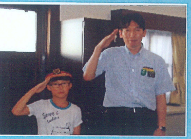
且カ役さんありがとうございました。

両電車が走るのは当たり前と思っ、ていましたが、駅長さんは「電車には社員全員が安全に運転できるように毎日努力」と話してくれました。東京オリンピックも4年後に始まりますが、東武鉄道を利、用してたくさん、の外国人が来て、もっと日光の、良いところを、知ってもらいた、いと思いました。