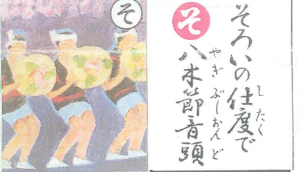
「そりの仕度でハ木節音頭」

上毛電鉄では、サイクルトレインといって電車に自転車を乗せることができます。学生さんなどには便利です。また、レンタサイクルもおこなっています。レンタサイクルに行く観光地は、有楽館や絹織記念館、桐生が岡動物園などが人気です。