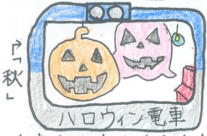
「秋」 ハロウィン電車