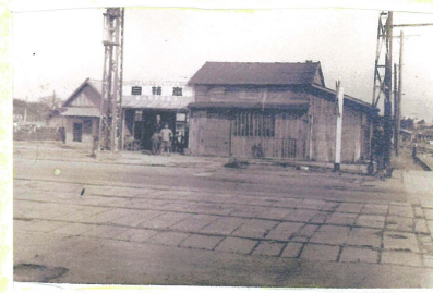
昭和22年(西暦1947年)おばあちゃんの家(当時)