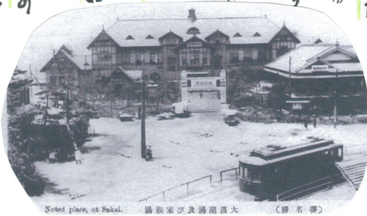
Noted place, at Sakai. 湯敷家及び湯瀬園大 (署名欄)

宿院ー大浜水族館前を走っていた。近にある大浜公園には明治36年に水族館があった。公会堂 潮湯 (写真潮子符) 海水浴園内 遊園地 動物園 窓かなりのに がいを見せました。