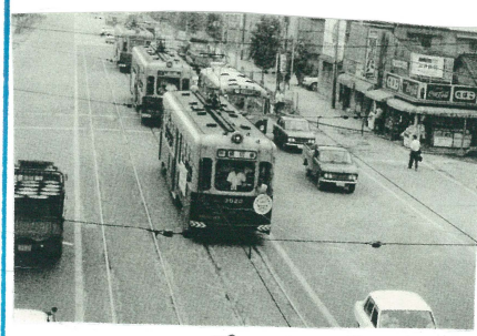
大阪市電最後の堺区昭和47年

大阪市電三宝線と阪堺電気軌道(大浜支線)かつて堺市内には大阪市電阪堺電気軌道(大浜支線)が走っていた。三宮線がある。おばあちゃんの家の前を走っていたのは大阪市電とわかった。横を走っていたのは阪堺電気軌道。