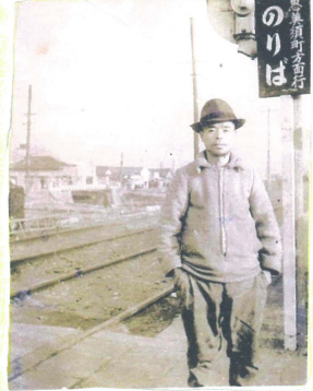
電車の切符を売っていた親せきのおじさん