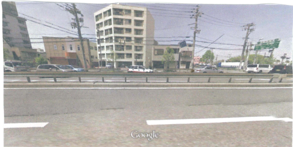
撮影日: 4月 2015 © 2015 Google

お母さん「昔は、おばあちゃんの家の前を電車が走ってたんだって」と聞いてビックリ。 左の字直六のとおり、今は車がらばい走っていて、想像もつかない。 ホントかウソか調査してみることには……。 いつもの通り、昔は、おばあちゃんの家の前を電車が走っていた??