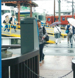
② 観光客登山客でもにぎわう河口湖駅。雨の日に観光客に聞きました。改札口から駅ホームまで線路を渡るの、すべてを転びそうな人も見かけました。改札口から駅前ロータリーのバス停までも、屋根が欲しい。