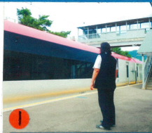
① 高尾山駅に到着する富士急行線。観光客を1日に5千人運べる。(同時に登山客も調整可能) 更に登山客も調整可能

④ 通勤電車6000系に乗ってみよう! 木の床や吊り輪5柄のシートが忙しい毎日をいやしてくれるよ。