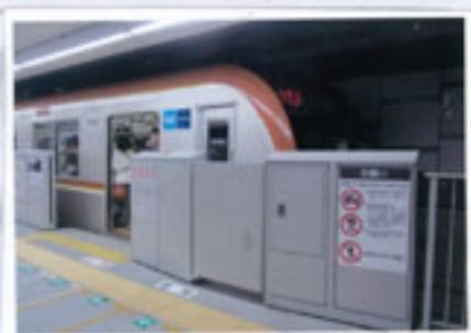
車両は副都心線の。東急線渋谷駅の表示板