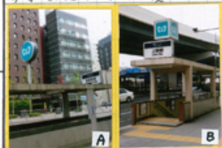
新富町駅①出入口 上野駅④出入口

東京メトロは2020年度に向けて「東京メトロ自らのエコ化」「東京メトロを使ってエコ」「沿線地域とエコ」の3つのテーマに基づき、かん境保全活動を展開しています。自らのエコ化として、 かん境配慮型車両の導入 、 駅構内・車内照明・サインシステムなどのLED化 、 東西線ソーラー発電所計画の推進 に主に取り組んでいます。また平成27年度までに、 駅出入口のシンボルマーク を丸型標示(写真A)から四角型標示(写真B)に切り替える予定です。シンボルマークなのに、丸型は横方向から確認しにくいですが、四角型にすると四方から確認しやすくなり利便性が上がります。