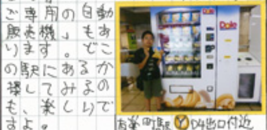
有楽町駅⑤4出口付近

2011年11月に東京メトロの東京駅に設置されてから好評で2013年3月から、たまたま池山玉駅⑩と有楽町駅⑤に新たに設置されました。おなじ人は利用したことありますか？今回も買ってみました。持ち主に便利ならバナナ、プを買って食べたところでもおいしか、たです。手軽に買えるのでおやつなどに利用してみたいかたがたしょうか。自販機右側にはごみ投入口がついていて上が袋用で下がバナナの皮用です。その場で食べた場合は、そちらに分別して捨てましょう。メトロでは「カッターン」専用の自動販売機もあります。どこかの駅にあるかた探してみよう。