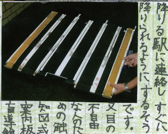
降りる駅に連絡しすぐに降りられるようにするそうです。又目の不自由な人のための融知四式案内板

新しいスロープを作ったことです。実際歩いてみると新しいスロープはゆるやかで、これなら車イスの人でも楽だと思います。もちろんエレベーターもあります。また車イス用のホームと電車の段差をなくすための折りたたみ式のボードもあり見せてもらいました。車イスのお客さんが東向日駅で乗車されたら内線電話で