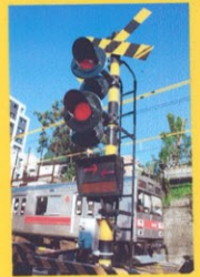
左右の写真 代官山付近の踏切

ここには沢山の民鉄が走っています。中でも2012年に東京メトロ副都心線と地上を走る東急・東横線が相互乗り入れが予定されています。それに合わせて、東横線が地下に移乗します。また、周辺も私たちが利用しやすいように変わります。他にも、どんな使いやすさ＝"便利"があるか調べてみました。便利調べ... スタート!