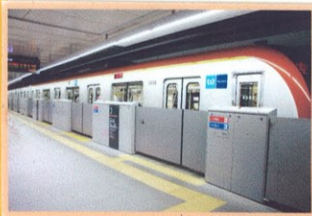
副都心線 渋谷駅のホームドア 開くと可動ステップが出てきます。

東京メトロでは、ホームでの安全対策のためホームドアや可動ステップを設置しています。ホームドアは→ホームからの転落防止、可動ステップは→ホームと電車の間に狭まれる事故を防ぐのに役立っています。