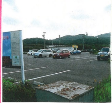
大学前駅の駐車場

◇お得切符いろいろ 上田市では、駅から自宅がは なれている人がほとんどなので 電車に乗って帰るための切 符に無料の駐車券が用意 されています。