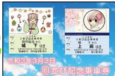
(令和3年3月3日 3並び記念乗車券) (千曲川橋梁全線開通ロゴ)

(発売情報は上田電鐵 HP： https://www.uedadentetsu.com )