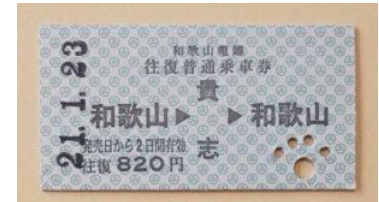
『硬券式往復乗車券』 肉球型の特注改札鉄により入鉄（肉球パンチ）