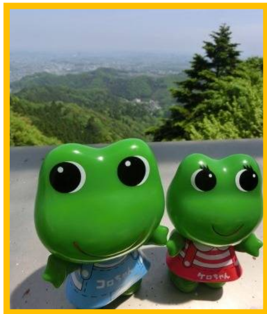
高尾山にアタックする山ボーイと山ガール