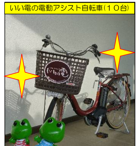
いい電の電動アシスト自転車(10台)