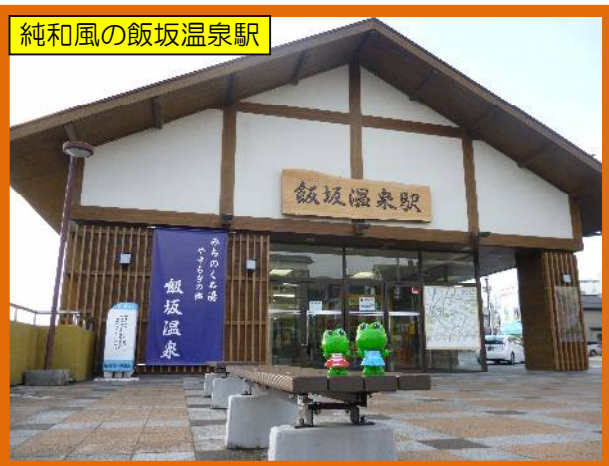
純和風の飯坂温泉駅

(コロちゃん) 坂道の多い温泉街も平気。行動半径もぐーっと広がるね! (おなかもグーって鳴ったコロ)