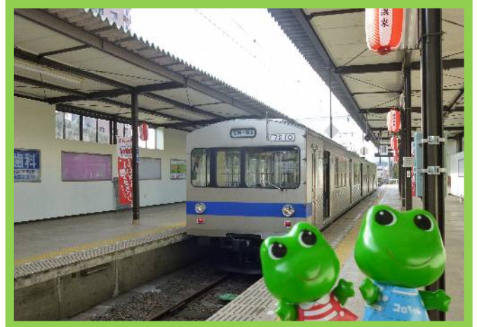
飯坂温泉駅に到着したケロ! わくわくするコロ!

ふたりは、いい電「1日フリーきっぷ」の特典を使って、温泉を満喫しちゃったよ (=^▽^=)