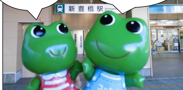
※「ケロちゃん」「コロちゃん」は、興和㈱の登録商標です。