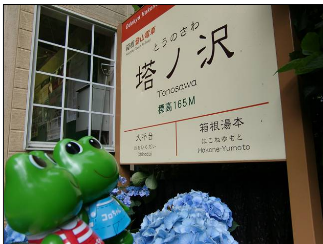
※「ケロちゃん」「コロちゃん」は、興和株の登録商標です。