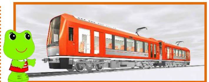
導入が決まった3000形車両のデザイン