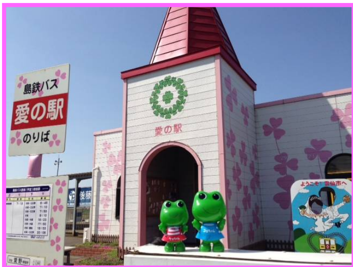
※「ケロちゃん」「コロちゃん」は、興和㈱の登録商標です。