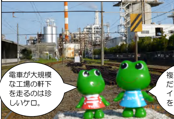
岳南原田(はらだ)駅の近くを探検

(ケロちゃん) 「鉄道」から「電車」になって、親しみが増した感じがするケロ。ふたりは、前向きにがんばる岳南電車をいっしょうけんめい応援しちゃうよ！