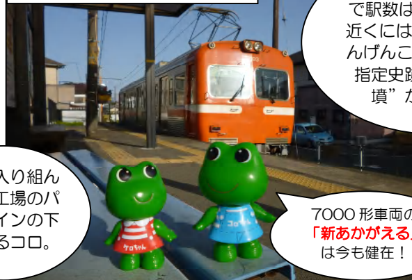
神谷(かみや)駅でひと休み

岳南電車の路線は9.2kmで駅数は10。神谷駅の近くには、浅間古墳(せんげんこふん)という国指定史跡の“前方後方墳”があるコロ。