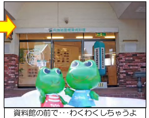
資料館の前で…わくわくしちゃうよ