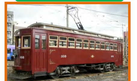
明治電車は、明治44年5月に川崎造船所が製造したツーマンの木造車両。現在も、記念イベントなどで運行されます。