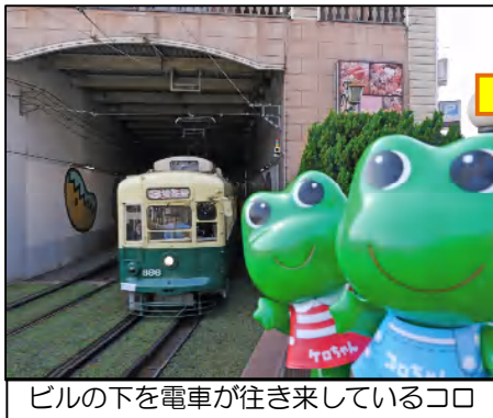
ビルの下を電車が往き来しているコロ