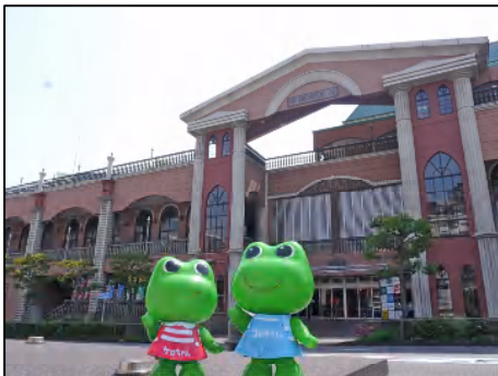
長崎西洋館は浜口町電停から徒歩1分

(ケロちゃん) 「長崎路面電車資料館」は、絶対はずせない長崎の観光スポットだケロ！