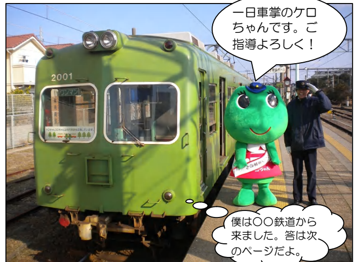
はじめてタスキをつけて電車に乗務したケロ～