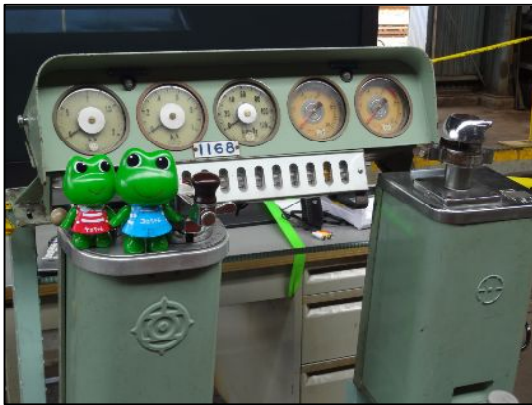
車庫内のシュミレーションで運転体験に挑戦！