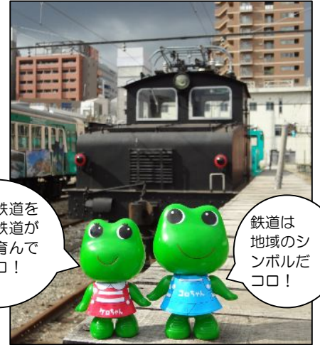
デキ型電気機関車 (1924 年・シーメンス社製)