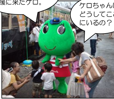
よいこのみなさんに大人気