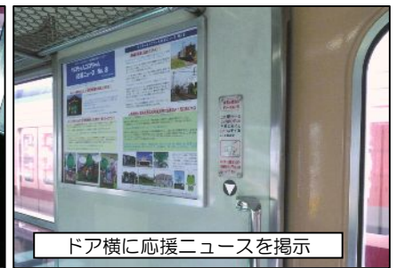
ドア横に応援ニュースを掲示