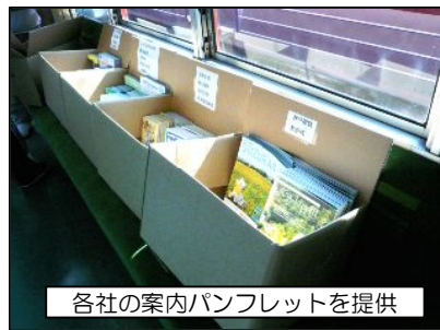
各社の案内パンフレットを提供