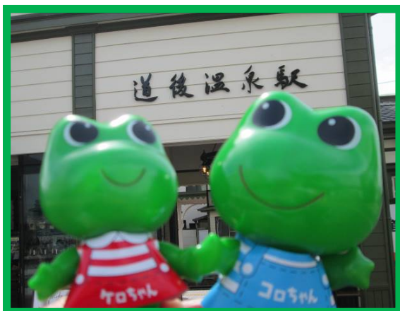
※「ケロちゃん」「コロちゃん」は、興和株の登録商標です。

松山で食べ過ぎて「メタボ注意報」発令中のコロちゃんも、歩いて汗を流したら、ちょっとスリムになったケロ～。