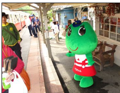
養老溪谷にまた来てね～、待ってるよ～