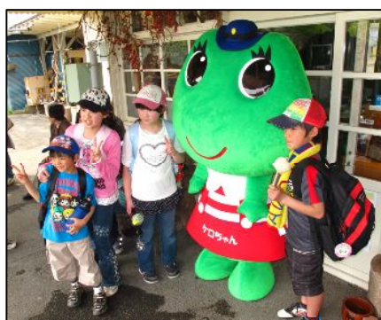
よい子のみなさんといっしょ