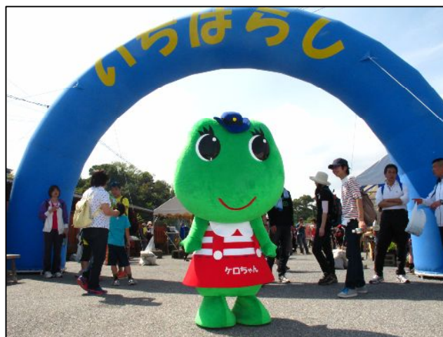
養老溪谷駅のゴール地点で癒しの笑顔をふりまくケロちゃん