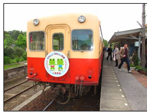
ふたりのヘッドマークも紹介しちゃうよ