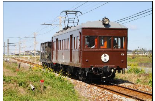
デハ101がホキ車を牽引

(増野さん) 「 デキ 」は電気機関車。当社の「 デキ3021 」は、平成21年に東京急行電鉄から譲り受けたものです。