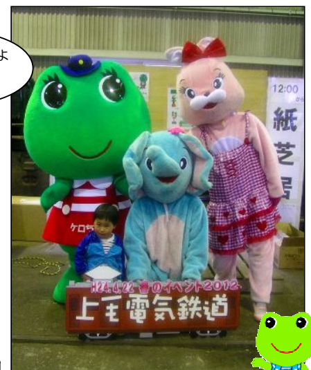
じゃんけん大会、撮影会で大活躍のケロちゃん