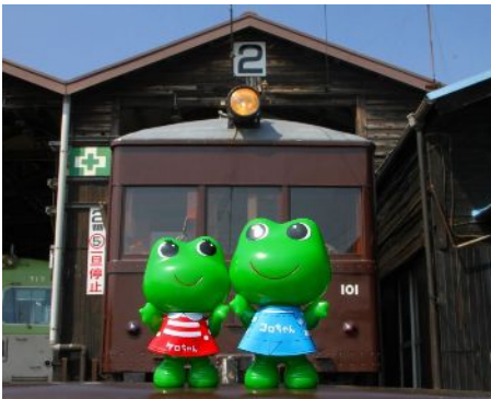
デハ101の前でご機嫌のケロちゃん、コロちゃん