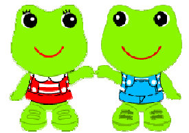
ケロちゃん コロちゃん