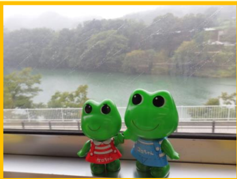
波久礼駅～樋口駅間