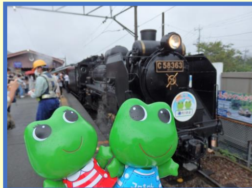
停車中のSLケロコロエクスプレス（長瀬駅）