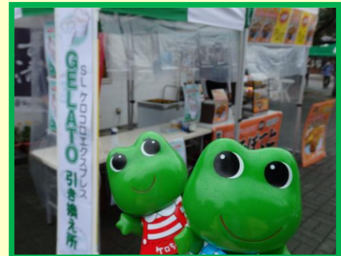
ジェラート引換え所（長瀬駅）