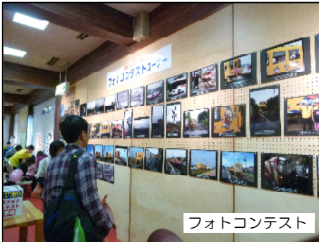
フォトコンテスト