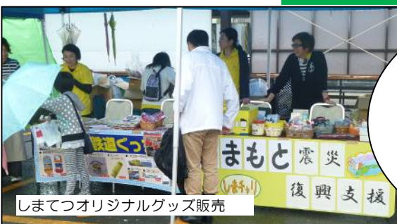
しまてつオリジナルグッズ販売

島鉄沿線の探検には・・・、「鉄道体験学習デジタル教材: 島鉄沿線 地域の大事典 ~自然と人々の歩みを訪ねる旅」を参照してね。日本民営鉄道協会のホームページにのっているよ。