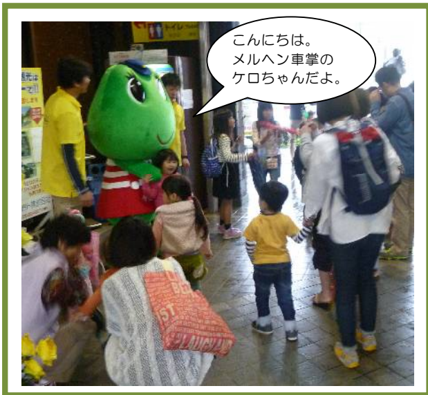
メルヘン車掌のケロちゃん登場！大人気だったケロ！