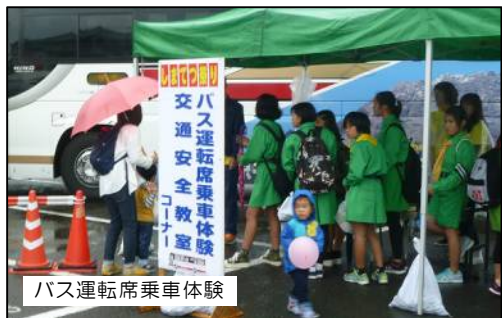
バス運転席乗車体験