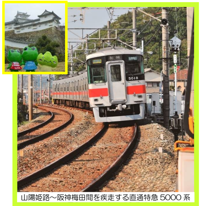
山陽姫路〜阪神梅田間を疾走する直通特急 5000 系