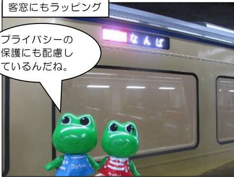
泉北ライナーのシンボルマーク