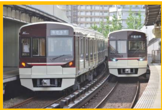
9000 形「POLESTAR II」

(ケロちゃん)「北急」の愛称で親しまれている北大阪急行電鉄は、 千里中央駅から江坂駅 までの約 6 km の区間を走っていて、全部で 4 つの駅があるケロ。