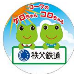
特別ヘッドマークイメージ