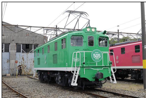
EL ケロコロエクスプレス (EL505号) のイメージ