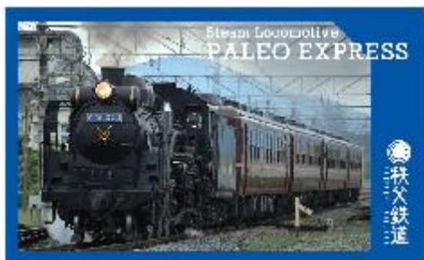
秩父鉄道オリジナルカード