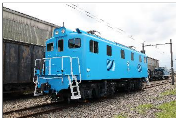
EL ケロコロエクスプレス (EL302号) のイメージ