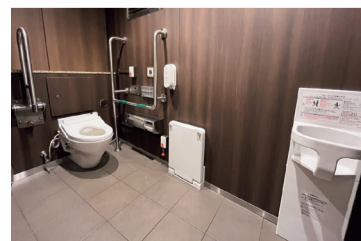
大阪梅田駅3階構外コンコース車椅子利用者用簡易型ブース

詳しくは ▶ 阪急電鉄ホームページ https://www.hankyu.co.jp/story/ekitoiletrefresh/ をご覧ください。