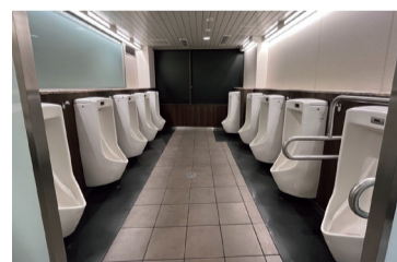
大阪梅田駅3階構外コンコース男子トイレ