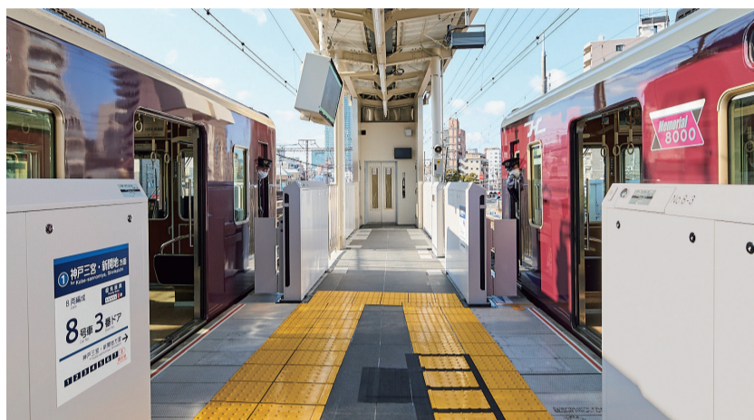
エレベーター・可動式ホーム柵が設置された春日野道駅ホーム(2023年2月9日撮影)

当社では、バリアフリー化をさらに加速するため、2023年4月より「鉄道駅バリアフリー料金制度」を活用し、ホーム柵(可動式または固定式)を2040年度末頃までに全駅に設置します。春日野道駅に続き、2025年春頃までに西宮北口駅・桂駅・蛍池駅において可動式ホーム柵の設置を予定しており、引き続き、安全・安心・快適な輸送サービスの実現に向けて取り組んでまいります。