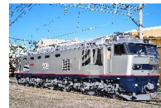
EF510 形式電気機関車 (JR 貨物)