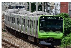
E235 系電車 (JR 東日本)