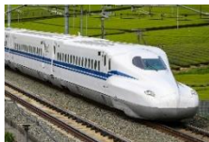
N700S 新幹線電車 (JR 東海、JR 西日本、JR 九州)