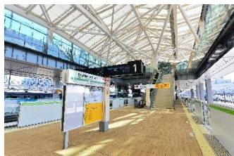
省エネルギーに優れる 「高輪ゲートウェイ駅」 (JR 東日本)