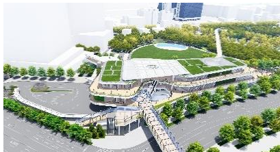
電力の 100%再エネ化や省エネルギーの地域冷暖房を活用した 「大阪駅 (うめきたエリア)」 (2025 年春全面開業予定) (JR 西日本)