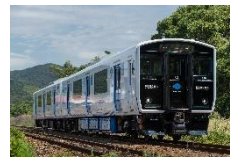
BEC819 系架線式蓄電池電車 (JR 九州)