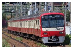
1000 形電車 (京急電鉄)