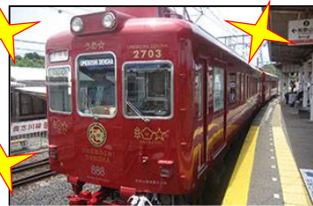
うめ星電車