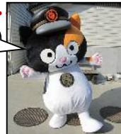
たま駅長代理