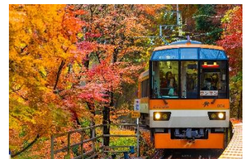
うなふいす @unafis_one (叡山電鉄株式会社)