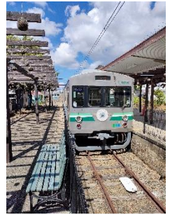
Take The D Train @TakeThe_D_Train (水間鉄道株式会社)