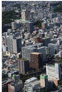
やめぴ。 @yamepi_12 (遠州鉄道株式会社)