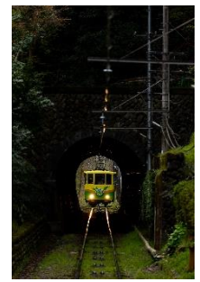
タビカメ @TTCM_tabikame (高尾登山電鉄株式会社)