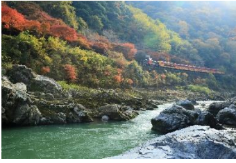
神戸のかっちゃん @Katch0727 (嵯峨野観光鉄道株式会社)