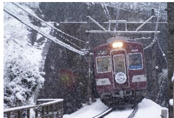
HK4210 @SRBHR1UjHo62555 (能勢電鐵株式会社)