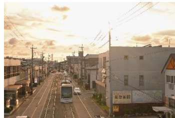
ざま @onigiri1700_new (豊橋鉄道株式会社)