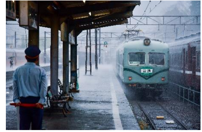
Kiyopon1048 @Kiyotob8000 (大井川鐵道株式会社)