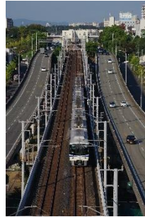
よっさん@吉之助 @Ys_Sensyu_Riki (泉北高速鉄道株式会社)