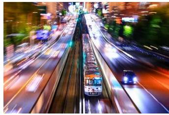
鉄道愛好家 @HIROYUKIMORIMO (北大阪急行電鉄株式会社)