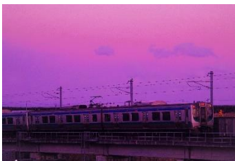
よしむら きょうへい @oshimurakyohey (仙台空港鉄道株式会社)