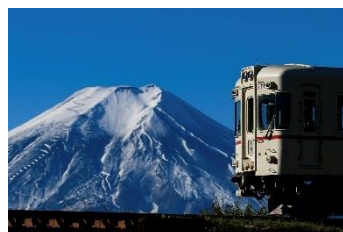
mitk @mitk_ (富士山麓電気鉄道株式会社)