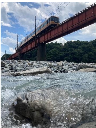
MCN @Karashi_NS (大井川鐵道株式会社)