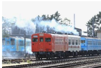
もりのくまさん @pDO5t41JMr72269 (水島臨海鐵道株式会社)