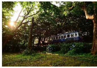
TOYOSUMAN @tram583tnc581 (銚子電気鉄道株式会社)