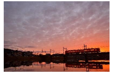
はらちゃん(puratanasu) @puratanasu1985 (一畑電車株式会社)