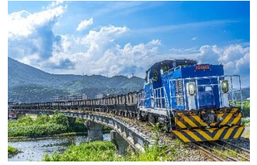
ma @zGPpLilgDf11251 (岩手開発鉄道株式会社)