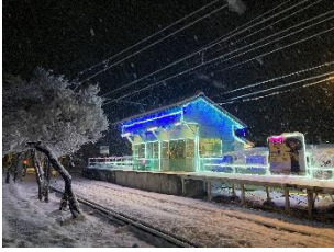
扶桑陸軍憲兵少尉 @長野県自衛官募集相談員 @mrZsV3lg6AoOgFU (上田電鉄株式会社)