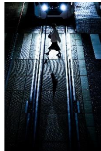
すや @sss87005532 (広島電鐵株式会社)