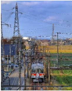
nandyryk @nandyryk1 (北陸鉄道株式会社)