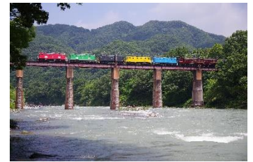
kominato @kominato40 (秩父鉄道株式会社)