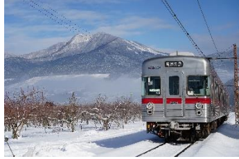
Non photo life @Nobuto87967705 (長野電鉄株式会社)