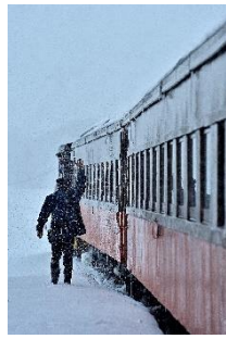
さすらいびと @sasuraibito5922 (津軽鉄道株式会社)