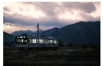
熊 @_higuma (アルピコ交通株式会社)