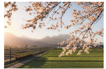
べにりゃ @B_N_SUN_Power (三岐鉄道株式会社)