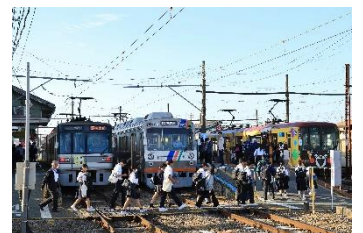
くみあい @kumiaisank4 (熊本電氣鐵道株式会社)