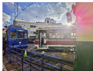
みんな @jttk9X4RwH5rxNT (長崎電氣軌道株式会社)