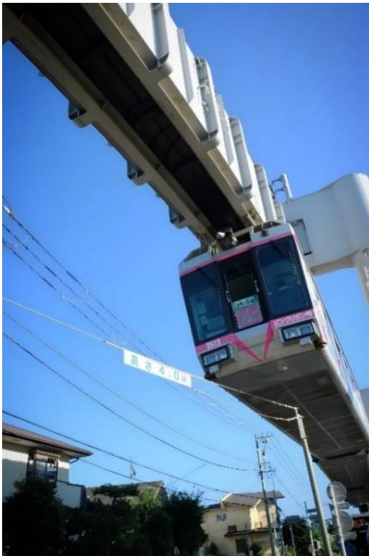
sakomachi @sanana34046652 (湘南モノレール株式会社)