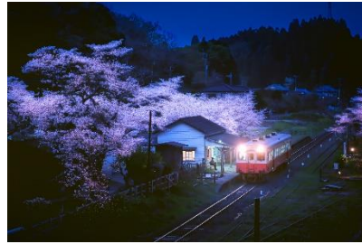
「臨」 @tacseik (小湊鐵道株式会社)