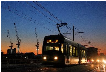
急行 梅小路 @umekoji_express (岡山電氣軌道株式会社)