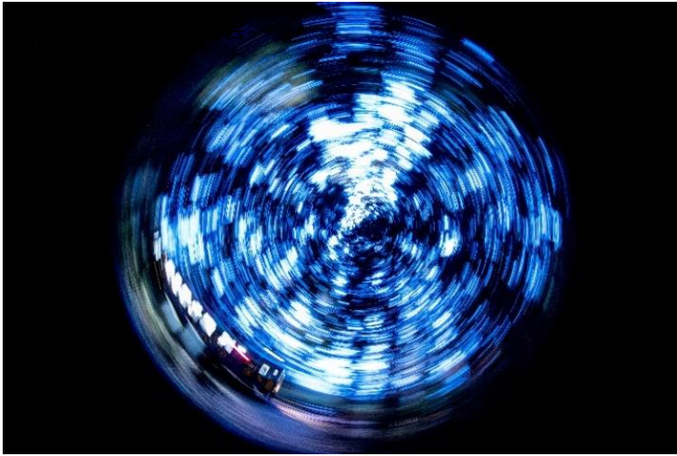
おらが湊鐵道応援団 @keha601 (ひたちなか海浜鐵道株式会社)