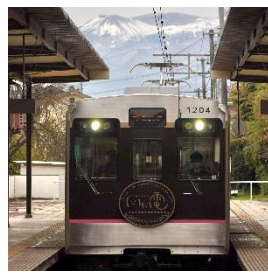
RT ファン @R63374075 (福島交通株式会社)