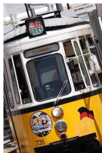
さつまはおりむし @miyagino3100 (福井鉄道株式会社)