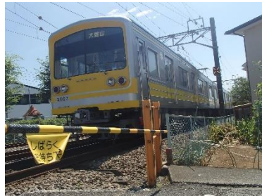
むしゅ @dlmfsLtd (伊豆箱根鐵道株式会社)