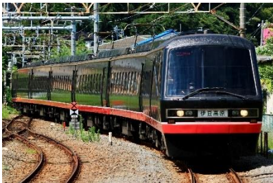
T.K @kokutetuzuki (伊豆急行株式会社)