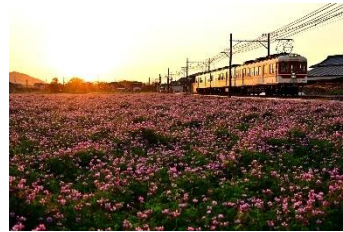
D51652 @D51652 (神戸電鐵株式会社)