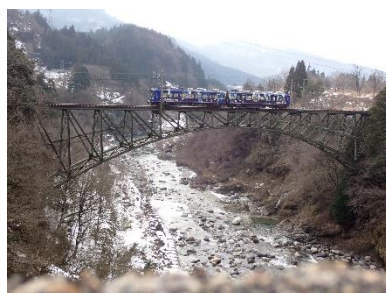
テッペ @VENpBRs5xd4426 (富山地方鐵道株式会社)