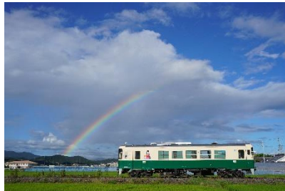
B型うお座 @1365KKT (紀州鐵道株式会社)