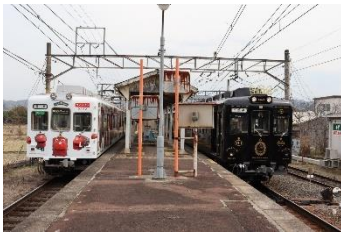
ぴーちゃん@ミーカ推し @peeche_an (和歌山電鐵株式会社)