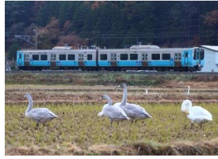
渋沢袁一▲@3010B_H5H2 (青い森鉄道株式会社)