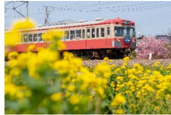
はこなん行き @642cassi (伊豆箱根鉄道株式会社)