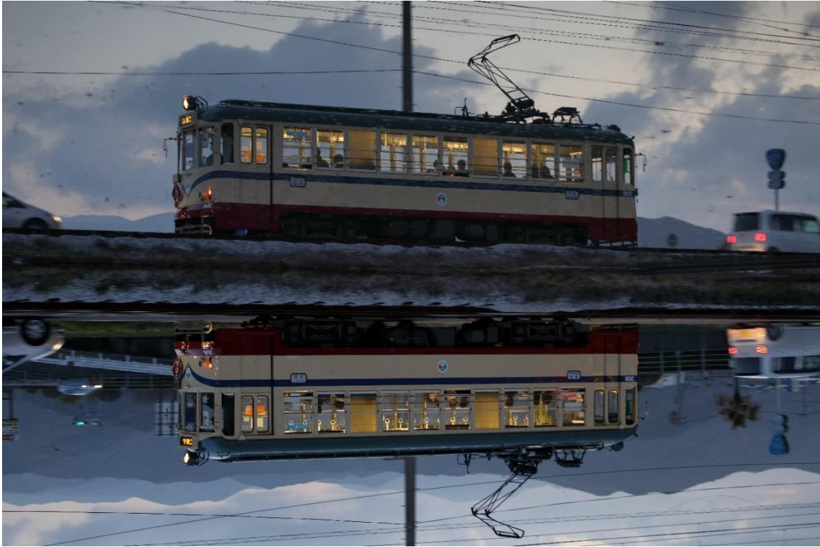
なやみ @nayamiyana (とさでん交通株式会社)