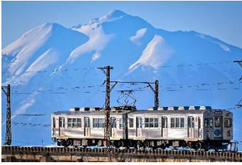
蒼生@青鉄@Aoi_Railways (弘南鉄道株式会社)