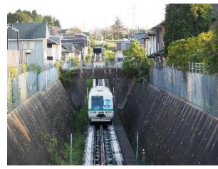
Nogizaka Chiyoda Line @ouibbs8lhJ6s4Hn (山万株式会社)