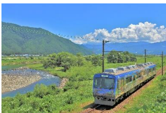
なご葱豆腐 @dkbukoro (えちぜん鉄道株式会社)