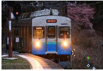
そねっち @kbVlwPJC9c13Dpg (伊豆急行株式会社)