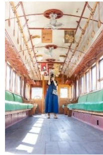
こもも @komomo_photos (上毛電気鉄道株式会社)