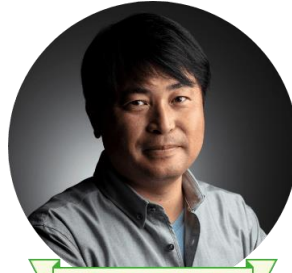
プロカメラマン審査員