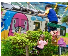
ころきち @korokichi241 (高松琴平電氣鐵道株式会社)