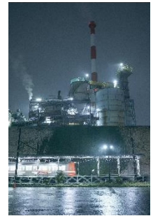
猫 @kuroneko_new (岳南電車株式会社)