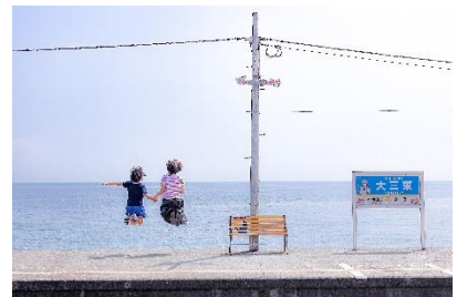
みんな @Thesentakuyasan (島原鐵道株式会社)