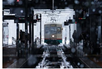
藍 @1151061n15 (富山地方鉄道株式会社)