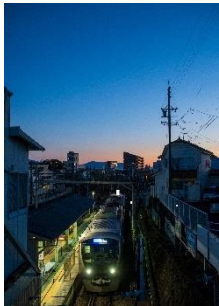
にん @Ning_YE (静岡鉄道株式会社)