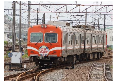
achamon @hayabusaso4221 (岳南電車株式会社)