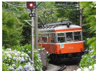
ギョカイオニク @gyokaioniku (箱根登山鉄道株式会社)