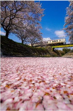
彩奈 Style 2021 @forever_saika (上信電鉄株式会社)