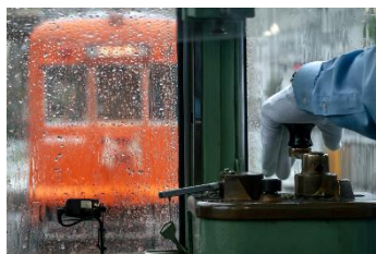
あきてつ @Akiryofe (伊予鐵道株式会社)