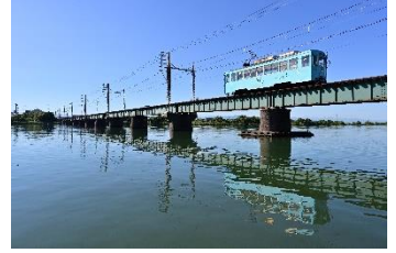
MATSU @MATSU85442470 (万葉線株式会社)