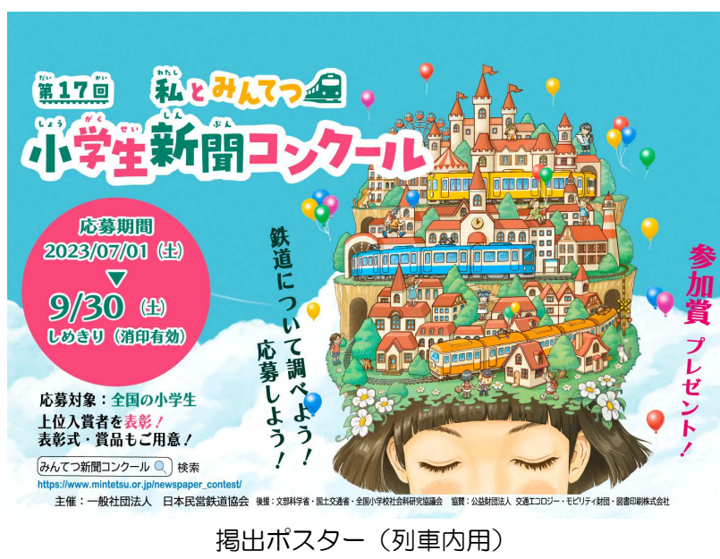
掲出ポスター（列車内用）