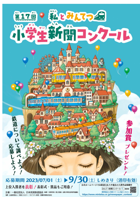
掲出ポスター（駅構内用）

また、鉄道への理解を深めることができる「みんてつキッズ」（小学生向けサイト）や「鉄道ってなあに？」（小学生向け教材）、新聞の作り方を紹介する動画をWEBに公開します。