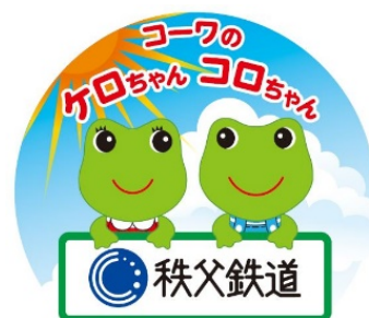
SLケロコロエクスプレスヘッドマーク イメージ