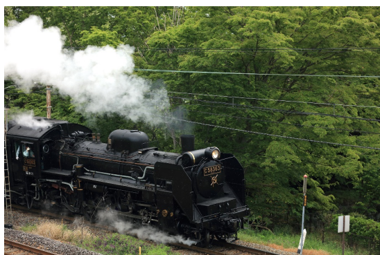
SLパレオエクスプレス イメージ