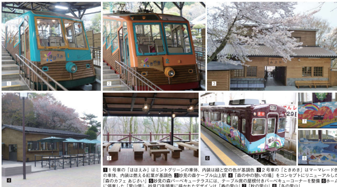
1 1号車の「ほほえみ」はミントグリーンの車体、内装は緑と空の色が基調色 2 2号車の「ときめき」はマーマレード色の車体、内装は燃える紅葉が基調色 3 妙見の森ケーブル山上駅 4 「森の中の憩いの場」をコンセプトにリニューアルした「森のカフェ あじさい」 5 妙見の森バーベキューテラスには、テーブル席の屋根付きバーベキューコーナーを整備 6 ホームに停車した「里山便」。妙見口先頭車に描かれたデザインは「春の里山」 7 「秋の里山」 8 「冬の里山」

一方、「日本一の里山」と言われる川西市黒川地区などの里山風景をPRする能勢電鉄初のラッピング電車「里山便」が4月13日から運行を開始している。宝塚大学の関係者による「里山における四季の歳時記が輪廻のようにいつまでも末永く続くことをイメージ」したデザインをラッピング。1編成全4両の前面・側面に春夏秋冬、昼と夜の里山が描かれている。運行予定はホームページに掲載しており、能勢電鉄では「川西市黒川地区をはじめとする素晴らしい里山風景の魅力を多くの方にお伝えしたい」と話している。