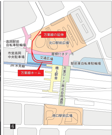
1 3月29日、万葉線の新しいホームで開催された「万葉線高岡駅開業式典及び出発式」2 3面2線になったホームでは電車が2列に並ぶ 3 大きなカーブを描いてホームに進むLRVアイトラム 4 万葉線高岡駅ホーム 5 クルン高岡と北口広場 6 高岡駅周辺整備事業・整備概要